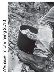
Weinlese im Steilhang 2018

Die angegebenen Flaschenpreise sind Mitnahmepreise und gelten bei einer Abnahmemenge von mindestens 6 Flaschen im Weinkarton.